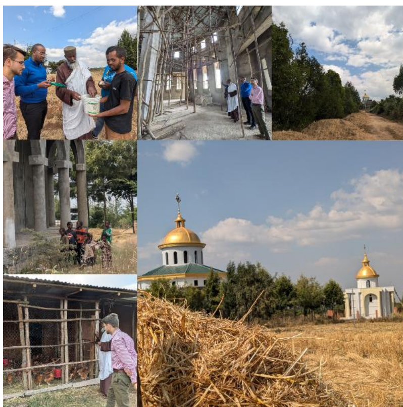
Photos du Monastère de Jésus